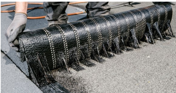
Unterseitige Dampfdruckausgleichskanäle. Dach für Beispielfoto nicht mit Voranstrich vorbehandelt.

Die durch Sonnenenergie entstehende Wärme erhitzt vorhandene Feuchtigkeit im Dachaufbau. Hierdurch wird flüssiges zu gasförmigem Wasser. Ein Tropfen Wasser kann eine fußballgroße Blase verursachen. Aufgrund dieser entstehenden Kräfte können sich bei herkömmlichen Dachabdichtungen Blasen auf der Dachfläche bilden, da sich der Dampfdruck nicht auf der Fläche verteilen kann. Dieses Problem ist mit den unterseitigen Dampfdruckausgleichskanälen lösbar: der Dampfdruck kann sich auf der gesamten Dachfläche verteilen, wodurch Druckbeanspruchungen der Abdichtungsbahnen vermindert werden können.